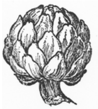
cor de carxofa

Una associació de foment del glosat, que té com a objectiu la recuperació, la promoció i la difusió del glosat en català, entès com a gènere poètic i musical que consisteix a improvisar versos sobre una determinada melodia.