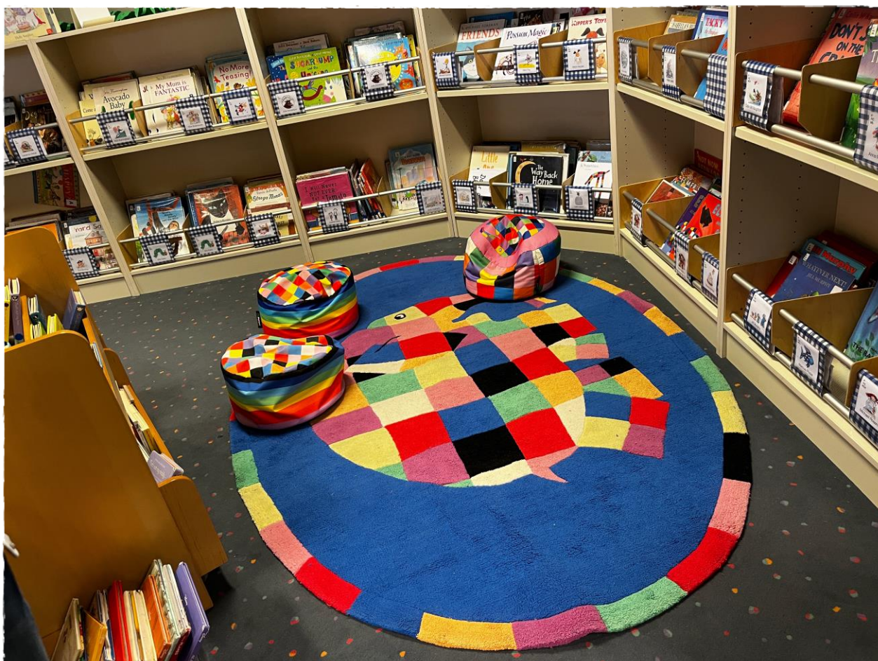
Biblioteca de Primària de la Vienna International School

Tal i com diu Jaume Centelles en el llibre La Biblioteca, el cor de l'escola! :