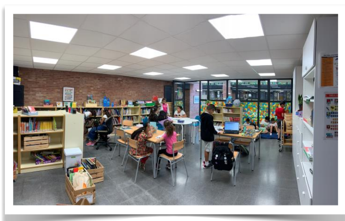
Biblioteca Escola Wagner

La Biblioteca de l’escola Annexa està organitzada en dues grans zones: la de Ficció, on hi ha tots els llibres d’imaginació des dels més petits fins als més grans, i la de NO ficció on hi podem trobar els llibres de coneixements que estan organitzats per grans temàtiques (no es fa servir la CDU internacional). En aquesta zona hi ha les taules per tal que els alumnes puguin treballar.