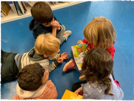
Biblioteca Escola Annexa Joan Puigbert