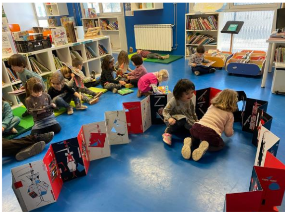
Biblioteca Escola Annexa Joan Puigbert

“És important recordar que organització i disseny de l'espai no és equivalent a decoració. L'organització de l'espai (i també la decoració) ha de convidar a la lectura i l'aprenentatge en totes les seves formes i suports.”