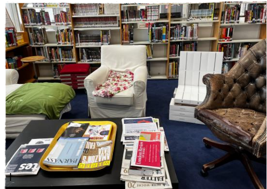
Biblioteca de Secundària de la Vienna International School