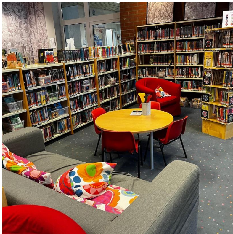
Biblioteca de Primària de la Vienna International School