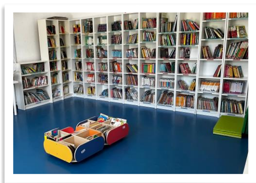
Biblioteca Escola Annexa Joan Puigbert

La Biblioteca de l’escola Wagner, sense disposar de massa metres quadrats, té els llibres organitzats en la zona de llibres d’imaginació i la de llibres de coneixements. Tanmateix, els àlbums il·lustrats es concentren a la prestatgeria de “Llibres Estrella” i, els còmics, es disposen en una prestatgeria especial. Tots els documents estan catalogats amb el programa epègam i ordenats segons la CDU.