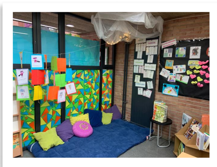
Biblioteca Escola Wagner