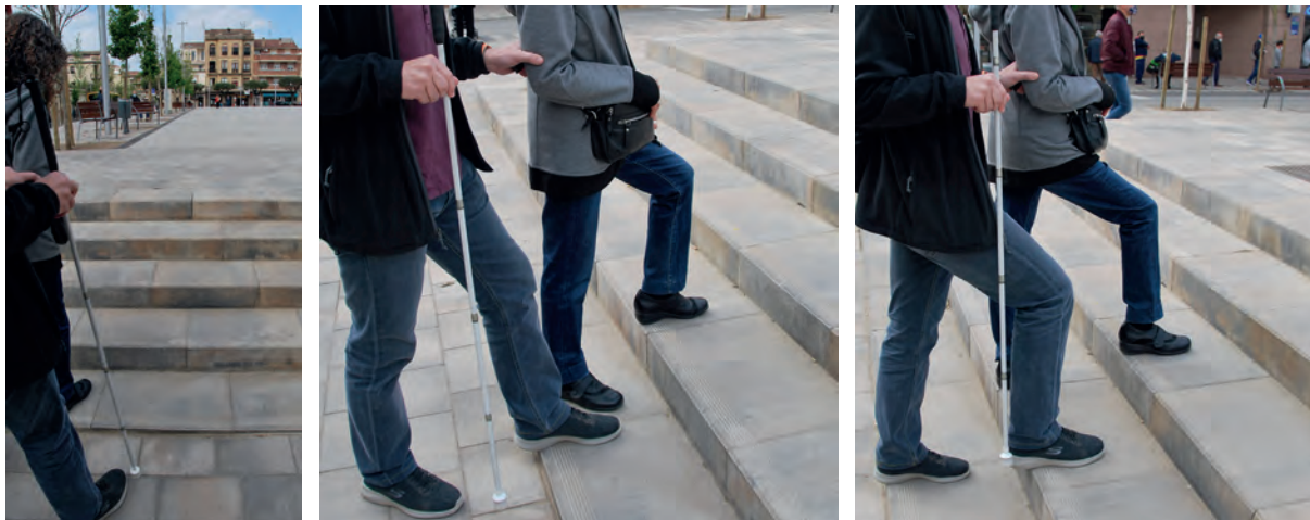
Foto: Persona amb ceguesa, amb bastó blanc i acompanyant, pujant una escala

És important avisar en trobar canvis d'alçada, irregularitats o possibles perills. Si el camí es fa més estret o difícil, alenteix el pas i desplaça el braç cap enrere, per tal que la persona et pugui seguir.