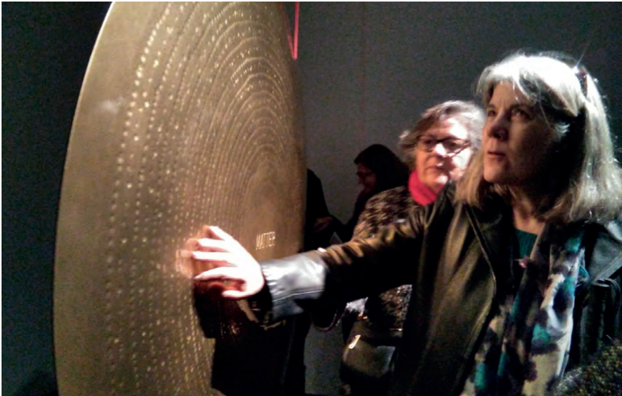
Foto: Visita a un museu. Descobrint l'obra amb el tacte

Podem dir, llavors, que distingim dos grans conceptes: la persona i l'entorn. L'accessibilitat,