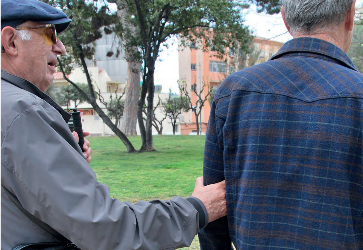
Foto: Persona cega passejant amb acompanyant

La teva ajuda sempre és útil, però és possible que no sempre sigui necessària o que la persona vulgui fer les coses amb independència.