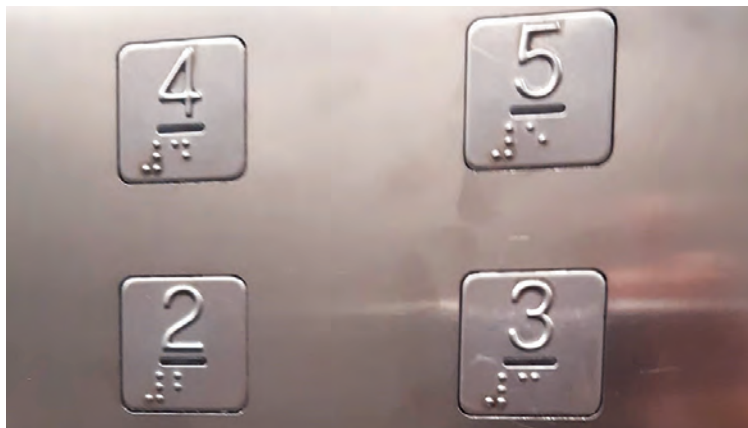
Foto: Ascensor amb números en braille

Sempre que sigui possible, incorpora el braille, sobretot en informacions permanents o importants com ara rètols, etiquetes de productes, màquines expenedores, ascensors, escales o accessos, per donar alguns exemples. És important tenir en compte que ha de ser senzill trobar la informació i, en el cas del braille, s'ha de poder tocar amb la mà. Si es