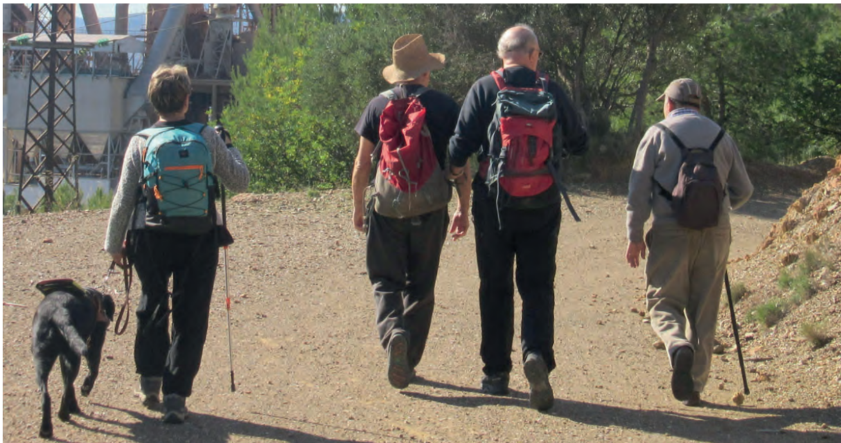
Foto: Grup de persones diverses d'excursió per un camí

Les relacions interpersonals són un àmbit molt important en el context d'una societat de persones amb capacitats diverses. Davant la diversitat, la naturalitat, el respecte i l'acceptació són bàsics en les relacions interpersonals. Tot seguit us donem algunes orientacions per facilitar la relació amb persones cegues o amb baixa visió: