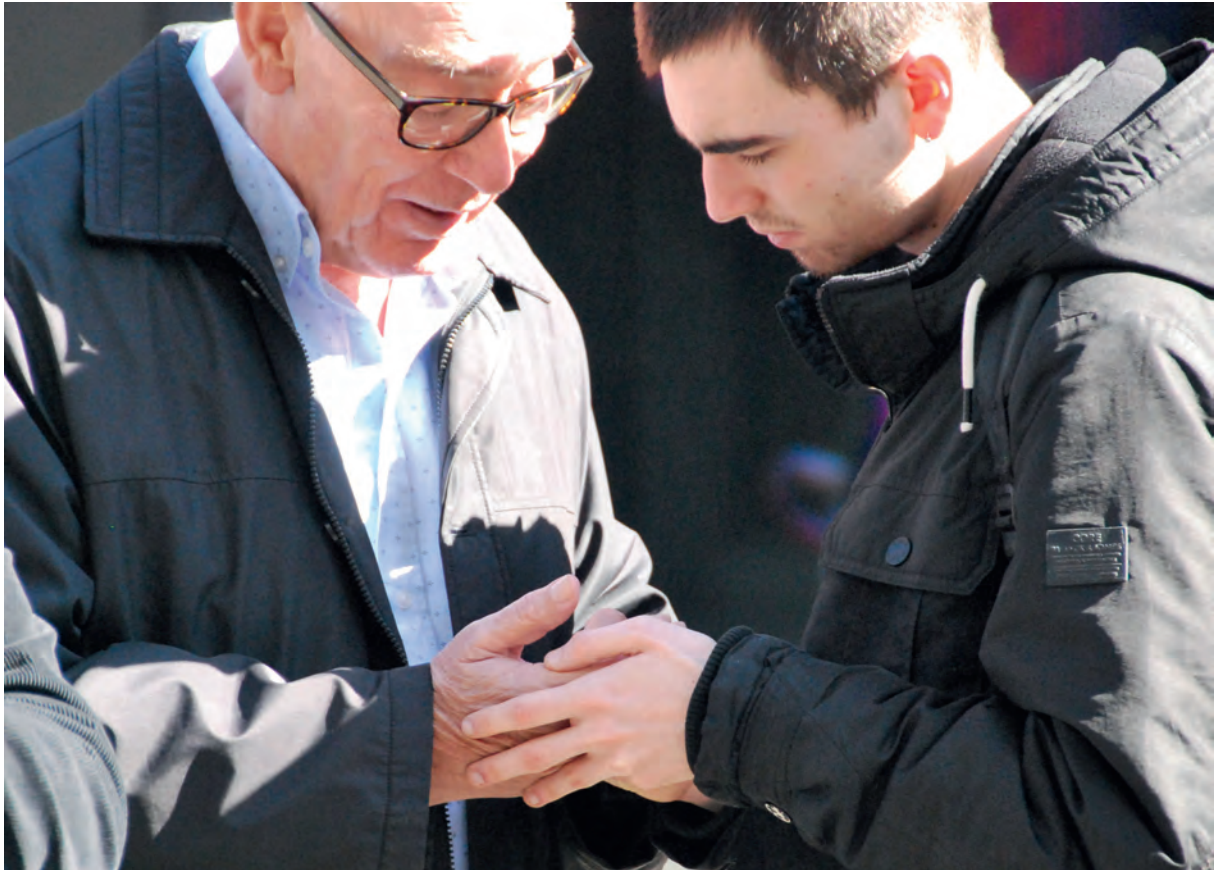
Foto: Persona sordcega amb acompanyant, comunicant-se amb els mans

funcioni. Si ens trobem a una discoteca, per exemple, el soroll ambiental no ens permetrà de sentir-hi o entendre les paraules d'un amic, és a dir, no tindrem un canal que ens permeti parlar. Si anem al Japó, necessitarem saber japonès per comprendre la gent, és a dir, haurem de conèixer el codi lingüístic, l'idioma.