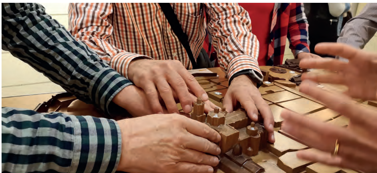
Foto: Persones cegues reconeixent una maqueta amb el tacte

Com hem vist, l'accessibilitat és una qualitat del disseny cada vegada més present arreu. Hem de tenir present que totes les persones tenen un seguit de drets que s'han de respectar. Tenim dret, per exemple, a l'educació, a un habitatge digne, a participar en