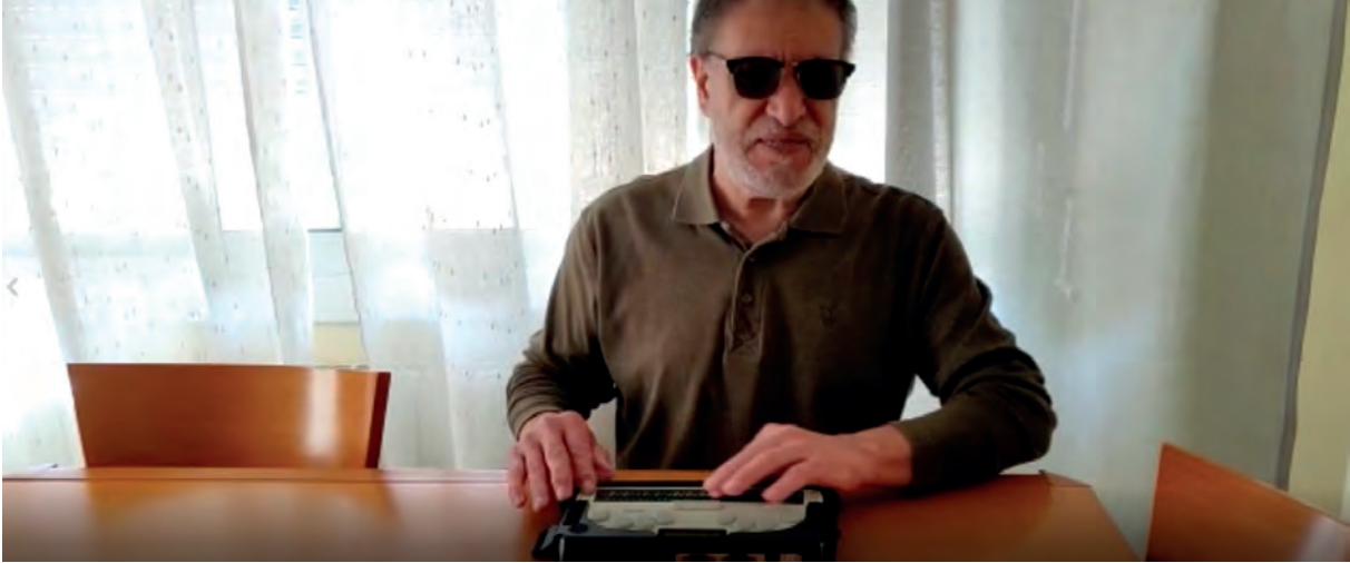
Foto: Llegint amb Braille Sense

Les persones cegues o amb baixa visió poden fer servir aquestes eines per accedir a la informació. En aquest sentit, hem de dissenyar llocs web accessibles, és a dir, llocs web que tinguin una estructura ordenada, compatibles amb programes lectors de pantalla i lupes i que continguin descripcions dels elements visuals.