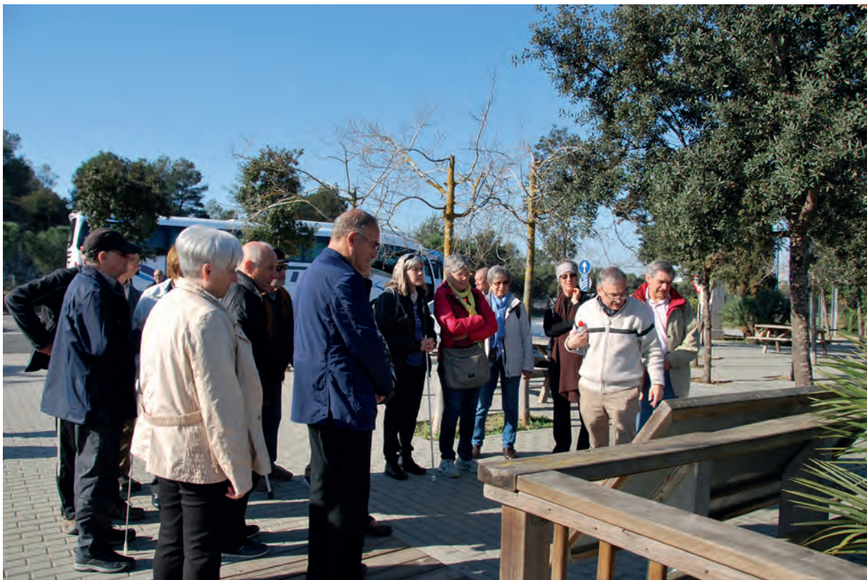
Foto: Grup de persones diverses, escoltant les explicacions d'un cartell informatiu

Expressions com ara “demà ens veurem” són naturals i no hi ha res que impedeixi utilitzar-les.