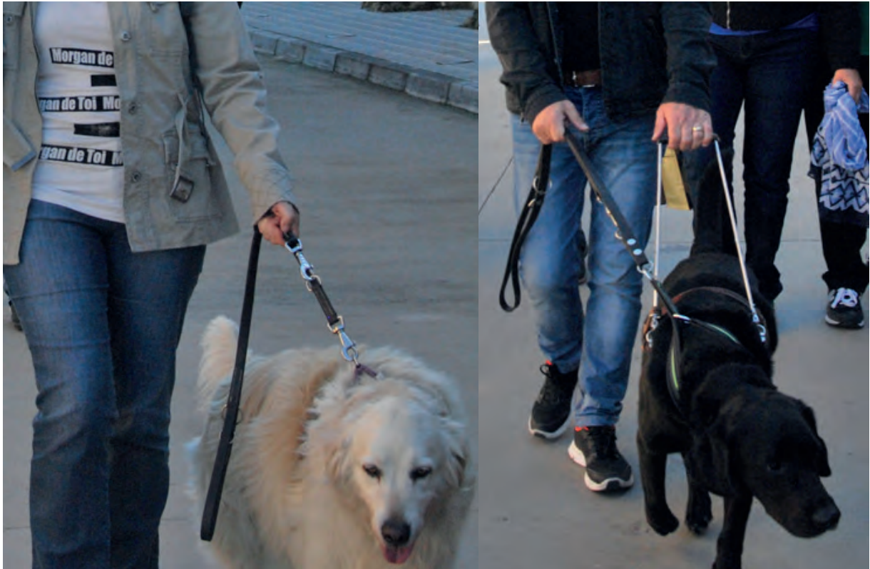
Foto: Dues persones amb gos pigall

Tingues en compte que, tant el gos pigall com el bastó, són suports per a l'autonomia i, si hi interfereixes, pots generar inseguretat.