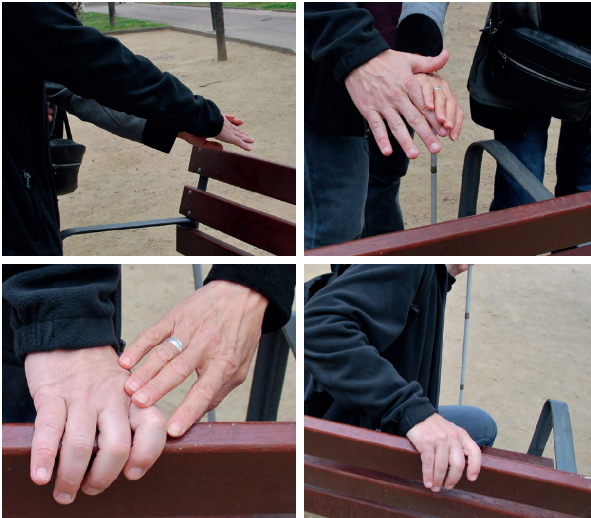
Fotos: Persona amb ceguesa a qui l'acompanyant li assenyala l'espai on seure

Vigila les portes i assegura't que no estiguin mig obertes, ja que poden provocar accidents. També ajuda que indiquis la seva localització.