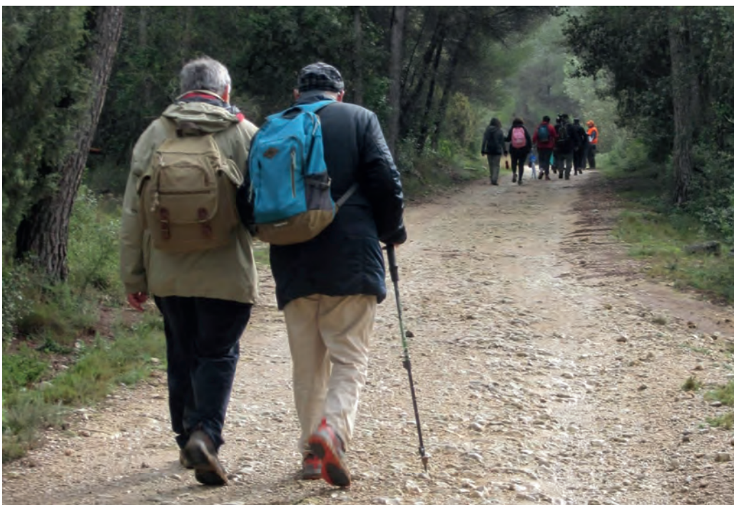
Foto: Grup de persones diverses passejant per un camí del bosc

Quan organitzis activitats, cal preveure les necessitats amb antelació. S’ha de pensar en les circumstàncies diverses que condicionen com es relacionen amb l’entorn les persones que participen en la teva activitat.