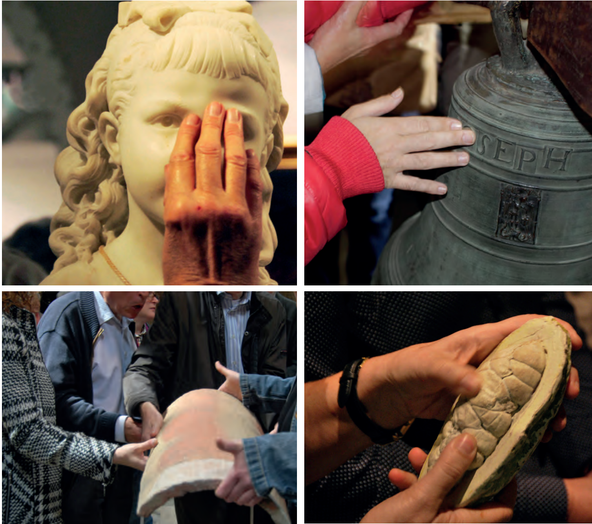
Fotos: Persones reconeixent els objectes amb el tacte durant diverses visites a museus

Cal tenir en compte que el temps és un aspecte important amb el qual cal ser flexible. Algunes persones necessiten més temps per desplaçar-se, per trobar els objectes, per llegir o per dur a terme qualsevol tasca que es proposi.