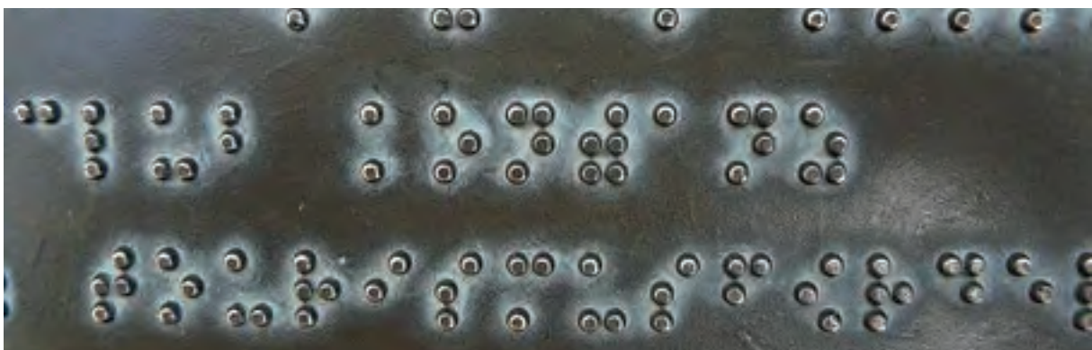
Foto: Placa de metall, amb text en braille, situada a l'exterior

descriu el quadre d'un museu mitjançant un codi QR, aquest codi QR no serà útil si l'usuari no el pot trobar. De la mateixa manera, el braille d'una parada de bus, desprotegit i a l'exterior, si és moll o brut, no serà adequat perquè els usuaris el llegeixin.