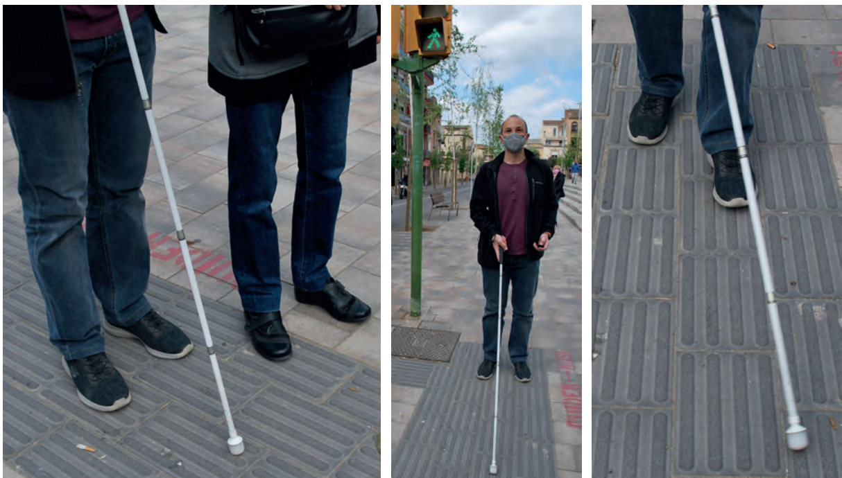
Foto: Creuant un semàfor amb senyalització acústica i encaminament

Les rampes dels accessos dels museus, les baranes de les escales o els ascensors a les estacions són elements arquitectònics d'accessibilitat física, tot i que n'hi ha molts més. El disseny urbà té molta importància. Els graons que separen la vorera de la