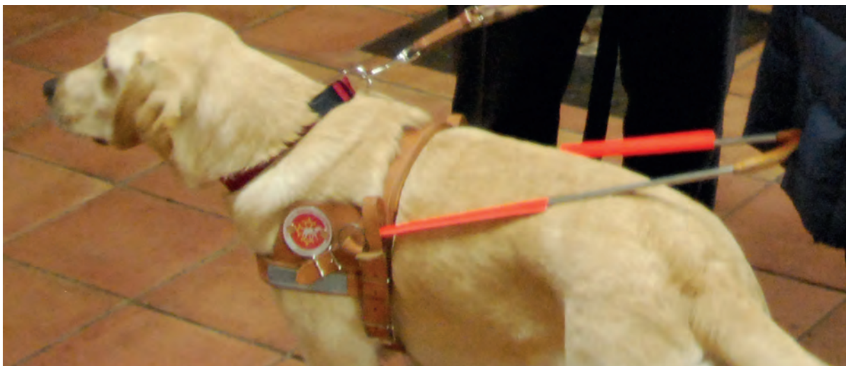
Foto: Gos pigall

És important conèixer alguns elements identificadors i suports a la mobilitat. El bastó blanc és un ajut per a la mobilitat de les persones cegues i amb baixa visió. Sovint les persones amb baixa visió fan servir el bastó com a identificació de la baixa visió, sobretot quan la discapacitat no es percep a simple vista per la gent. El gos pigall és un animal de suport per a persones cegues i amb baixa visió. Cal tenir en compte que el gos ha de mantenir l'atenció i no hem de cridar la seva atenció sense el permís de l'amo.