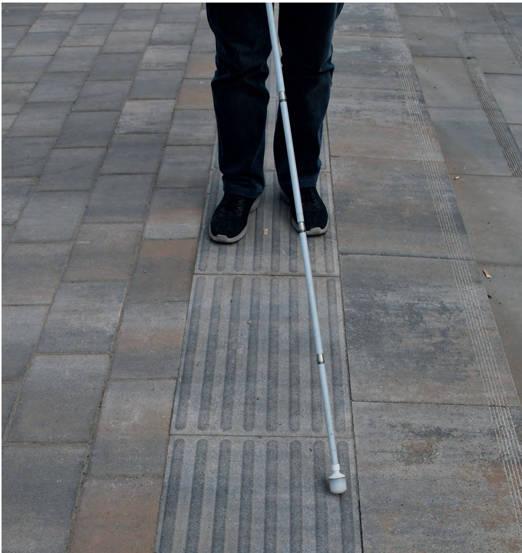
Foto: Persona amb ceguesa amb bastó blanc, creuant un carrer amb encaminaments

Per creuar un carrer, pots oferir el teu braç i indicar on és la vorera.