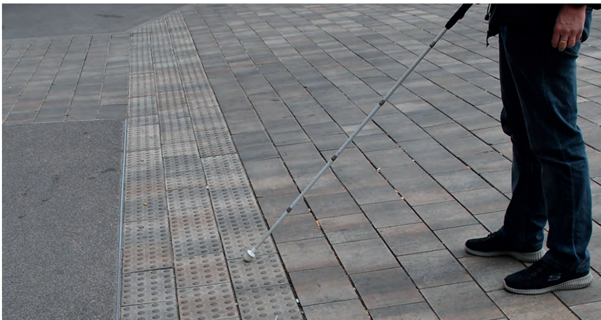
Foto: Persona amb bastó, en un carrer de plataforma única i encaminaments

Podem definir l'accessibilitat com la qualitat o la condició del nostre entorn que fa que aquest sigui adequat per a qualsevol persona. Dit d'una altra manera, l'entorn és accessible quan és amable i apropiat per a tothom. Què