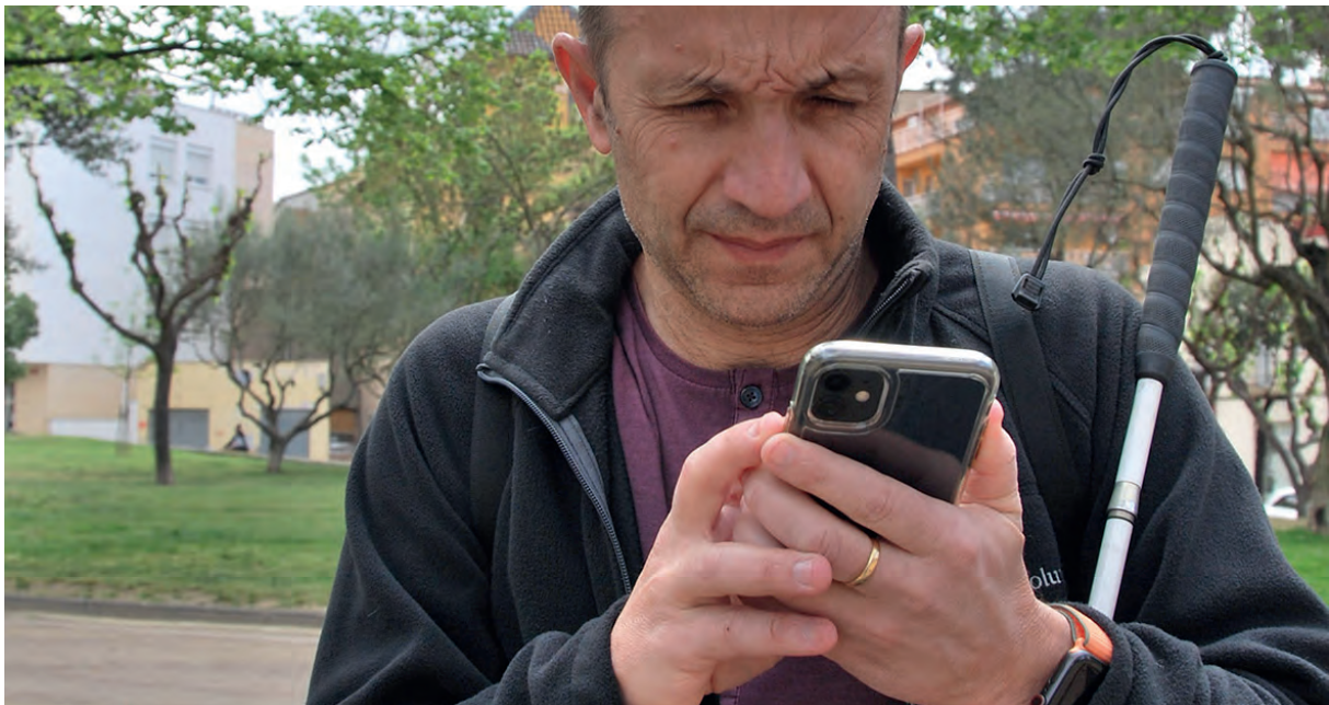
Foto: Connectant amb el mòbil

L'accés a la informació possibilita la relació i la interacció amb el món que ens envolta alhora que facilita l'autonomia personal. És també un dret de tothom i adaptar-la a les diferents necessitats de les persones, és responsabilitat de tots. Cal que s'hi impliquin les administracions públiques, les empreses i les associacions.