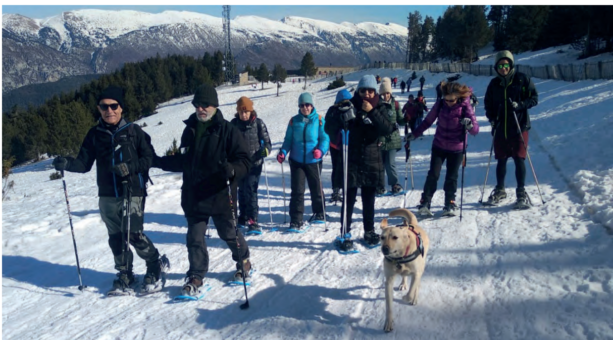
Foto: Grup de persones diverses practicant l'esquí amb raquetes de neu

La societat no és uniforme, sinó que és plural i diversa. Cada col·lectiu aporta des de la seva singularitat. La diversitat és una característica positiva i enriquidora, tant per a l'individu com per a la mateixa societat, atès que la societat rep, com a riquesa pròpia, la suma de les diferents aportacions dels seus membres.