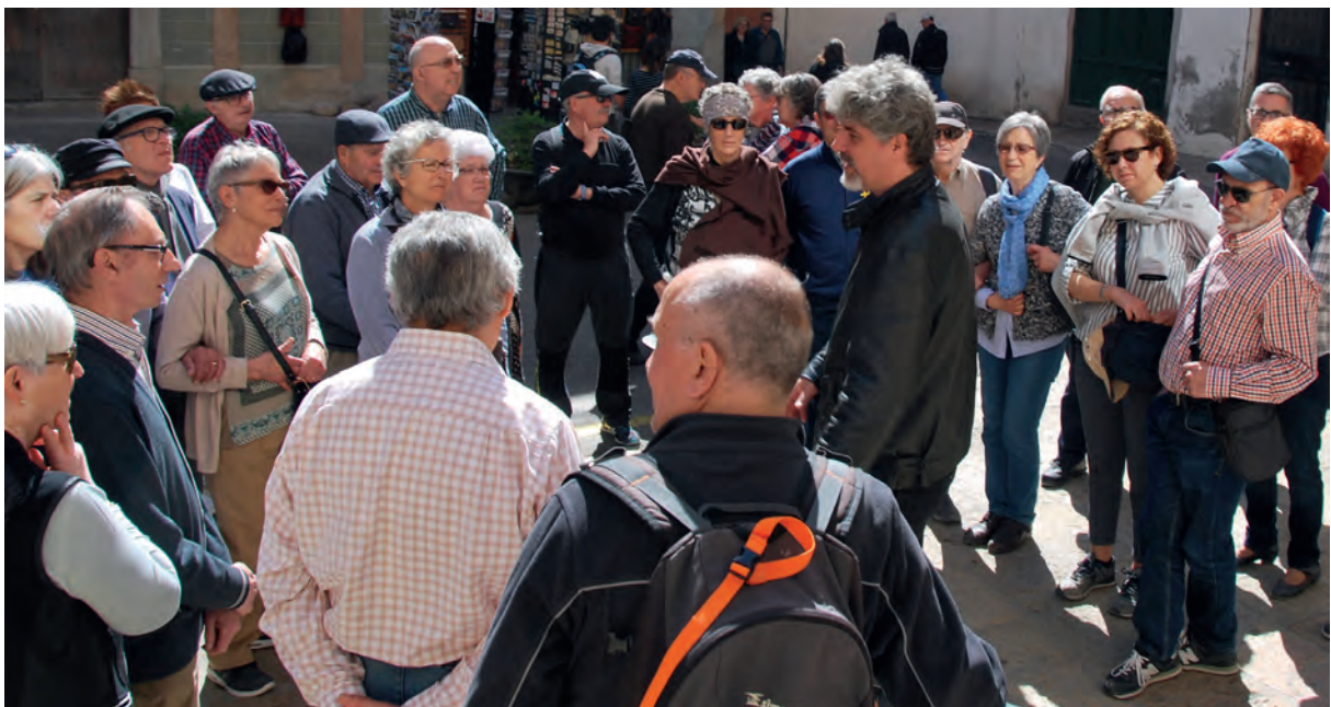
Foto: Un ampli grup de persones diverses escoltant la presentació d'un guia de museu

No som autosuficients i necessitem la col·laboració dels altres per resoldre els problemes que trobem a la nostra vida quotidiana. Per exemple, una professora pot necessitar un metge, si està malalta. Un metge pot necessitar, al seu torn, una tècnica informàtica, si s'espatlla el seu ordinador. En això rau la importància de la interacció entre el grup i, igual que el grup rep la riquesa de les diferents capacitats, també respon a les diferents necessitats.