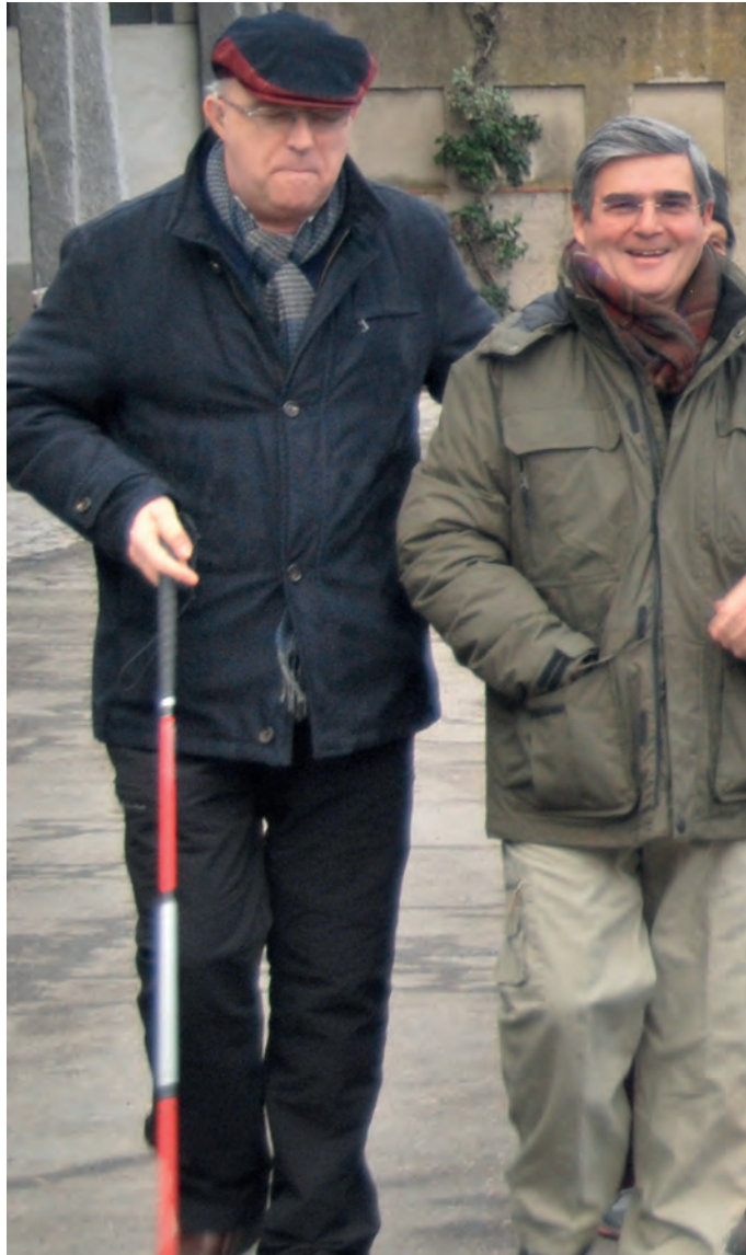
Foto: Persona amb sordceguesa amb bastó blanc i vermell, i acompanyant

A més, hem de saber que hi ha un bastó no tan comú, blanc amb franges vermelles. Les persones amb sordceguesa fan servir aquest bastó i és necessari que ho sapiguem si mai ens hi hem de comunicar.