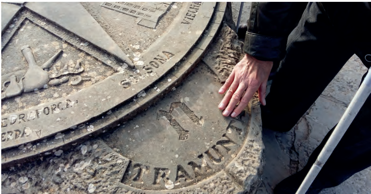
Foto: Reconeixent el text gravat en una pedra amb el tacte

D'altra banda, hi ha certs àmbits, com ara els serveis o els llocs públics o d'ús públic, en què l'accés a la informació adquireix especial rellevància. Pensem en els serveis públics com ara els hospitals, els ambulatoris o els transports. Tothom ha de saber on es troben les sortides d'emergència, a quina hora passarà el pròxim tren, per quina via passarà o a quina porta ens atindrà el metge.