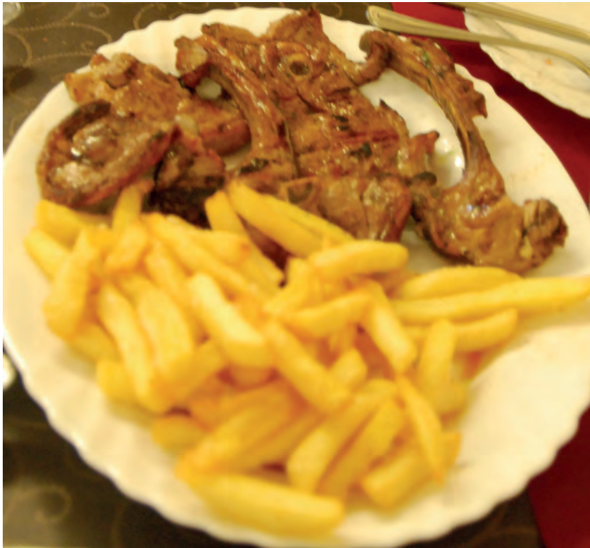
Foto: Plat de menjar d'un restaurant: Carn a les dotze i patates a les sis

A un restaurant, per exemple, és molt útil la tècnica del colze per desplaçar-se. A més a més, convé que indiquis on és la taula i la cadira. Resulta d'ajuda fer una descripció breu del lloc, en què expliquis on són els lavabos, els accessos o la barra. A taula, pots explicar la carta. No cal que llegeixis la carta sencera, sinó que pots orientar la persona que guies explicant els plats oferts. Per descriure què hi ha al plat, és recomanable utilitzar la tècnica del rellotge. Aquesta tècnica consisteix a considerar l'espai dins el plat com l'esfera del rellotge. D'aquesta manera, per exemple, es pot indicar dient "tens a les sis les patates i a les dotze, la carn".