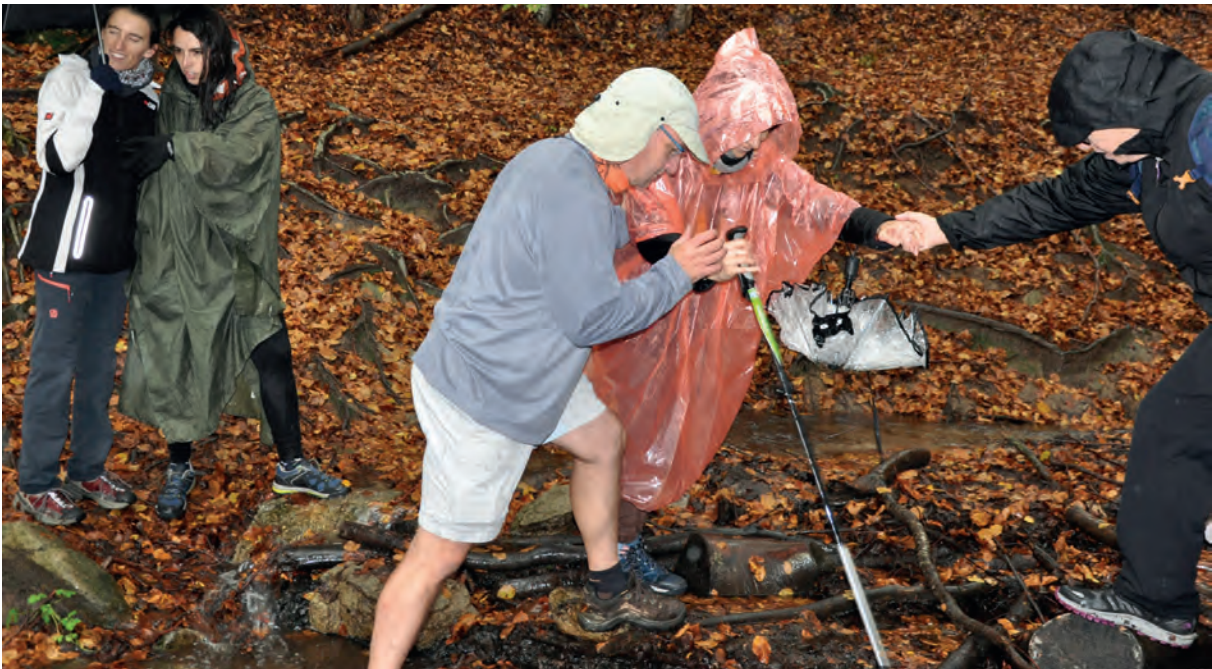
Foto: Companys ajudant a creuar un camí amb troncs i pedres un dia de pluja

El concepte d'inclusió fa referència a la capacitat de la societat per oferir a tothom la possibilitat de participar activament. Els grups socials, però, són variats. Per això, l'accessibilitat universal és un principi molt important per garantir la inclusió de tots els grups en la societat. L'accessibilitat universal és una forma de dissenyar pensant en persones de característiques diverses i que tenen els mateixos drets. Per tant, hem d'acceptar que la societat està conformada per persones amb característiques diverses i promoure la inclusió de la diversitat, per tal que tothom pugui viure de forma independent i desenvolupar plenament les seves capacitats.