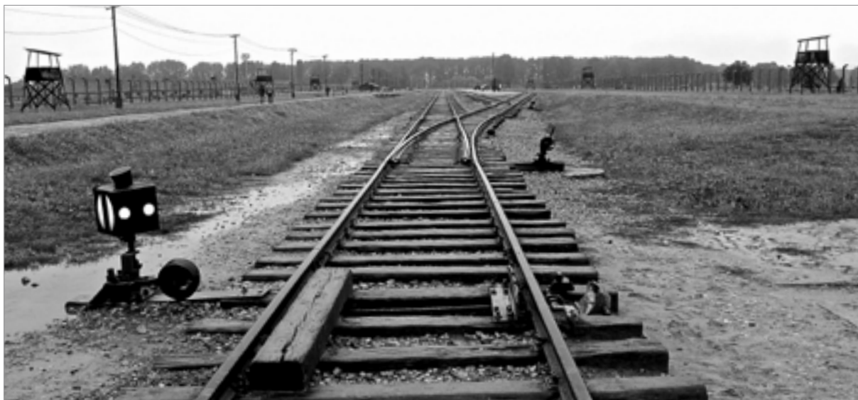
Zona de la rampa, a Birkenau, on es feia la selecció dels deportats pel doctor Mengele

íntegrament jueus, van ser traslladades, en general, en tren. Disposaven de personal encarregat de dur a terme la massacre sistemàtica, per mitjà d'una refinada maquinària per matar. Es recollien els estris, les maletes i els objectes de les víctimes, incloses les dents d'or i els cabells, i les autoritats els atorgaven diferents usos. El recinte on es classificaven el que duien els jueus es deia Suïssa a Birkenau, que vaig poder visitar el 2014. Els seus cossos eren incinerats en crematoris o en piles.