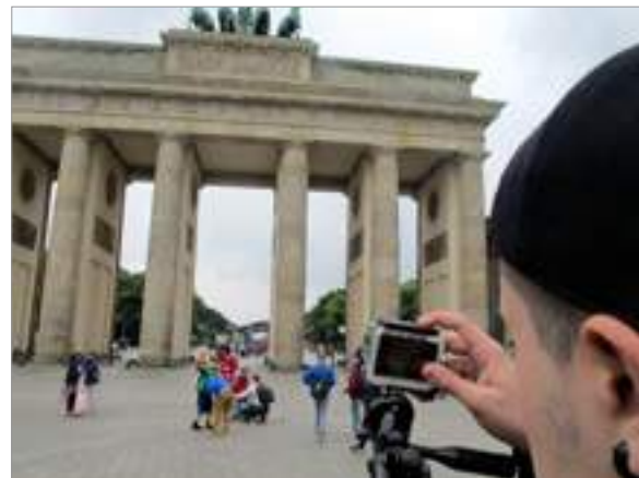
La porta de Brandenburg

El 1963, quan el president dels Estats Units John F. Kennedy va visitar la porta de Brandenburg, els soviètics van penjar-hi cortines roges per evitar que es pogués veure l'altra banda. A principis de la dècada dels 80, l'alcalde de Berlín Oest Richard von Weizsäcker va