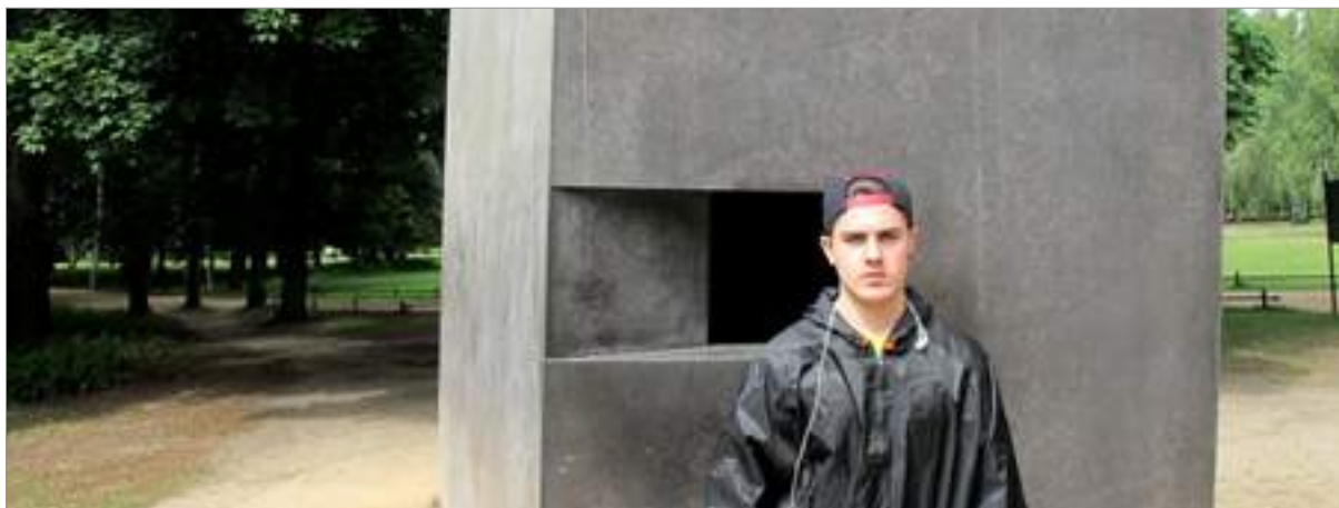
Monument als homosexuals víctimes de la Xoà, a l'interior hi ha un vídeo amb dos joves fent-se un petó

autoritzar. Va haver de superar molts obstacles i polèmiques: sobre el disseny, sobre la ubicació, sobre el fet que només estigui dedicat als jueus i no a totes les víctimes del nazisme; entre elles els gitanos i els homosexuals. També va crear polèmica per una ironia del destí: l'empresa que havia recobert els monòlits d'un producte químic antigrafitis era l'hereva d'aquella que va fabricar el gas Zyklon B, utilitzat als camps de concentració per als assassinats massius.