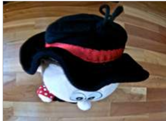
Angle zenital o picat extrem