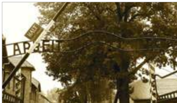
Porta d'entrada a Auschwitz I ( Arbeit macht frei : “el treball us farà lliures”)

Els camps d'extermini van ser construïts amb l'objectiu de convertir-los en llocs d'assassinat massiu per mètodes industrials. Milions de persones, gairebé