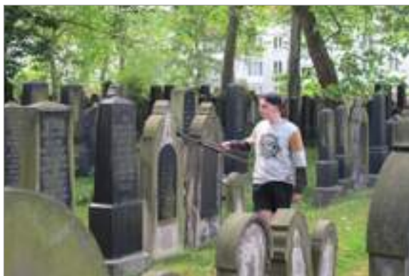
El cementiri antic jueu