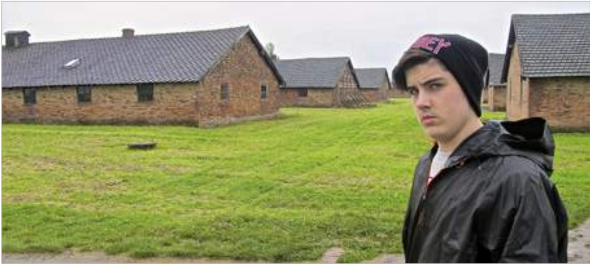
Els barracons d'Auschwitz-Birkenau que encara es conserven

Els cinc camps dissenyats exclusivament per a l'extermini, situats a Polònia, i alguns dels quals van ser oberts només uns mesos, són els ja esmentats de Chelmno, Auschwitz-Birkenau, Majdanek, Sobibor i Treblinka.