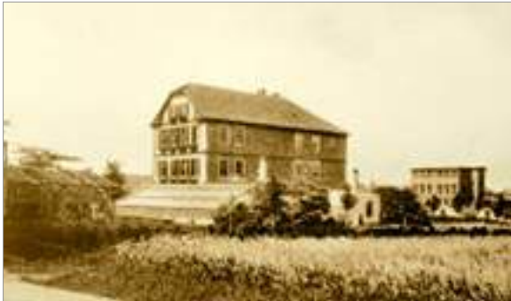
Ahlem el 1924, edifici central