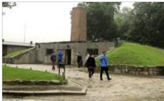
Cambra de gas i forn crematori a Auschwitz I

El sistema més perfeccionat de destrucció de persones. Els nazis tenien molt clar que calia eliminar milions de persones però sobretot, per si mai la història els anava malament, calia no deixar rastre de les víctimes. És per això que van construir els forns crematoris; per no deixar rastre. Henry llençava cadàvers a les