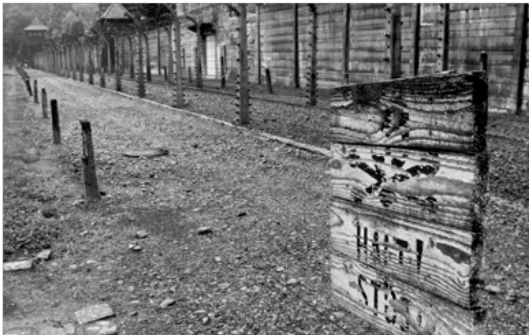
Fil ferrades al voltant del mur a Auschwitz I

Aquests homes, des del moment de la seva assignació, també estaven condemnats a mort. Eren els primers testimonis que les SS volien eliminar, de manera que els canviaven a intervals regulars, i el primer treball dels Sonderkommandos generalment era desfer-se dels cadàvers dels anteriors membres. El Sonderkommando havia d’“ajudar”: despullar els presos abans d’entrar a la cambra de gas, cremar els cossos i després desfer-se de les cendres. Després de la gasificació, el Sonderkommando havia de netejar la cambra de gas i classificar les restes dels morts, com la seva roba.