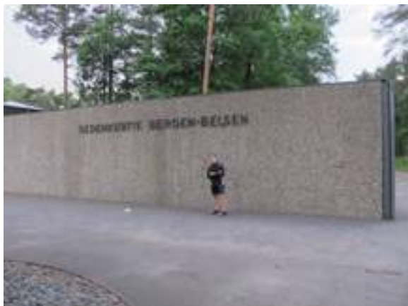
A la porta principal d'entrada al camp i a les instal·lacions del Memorial Bergen-Belsen

va canviar just en començar la guerra el 1939. I a partir de 1941 la idea ja va ser la d'eliminar tots els jueus d'Europa.