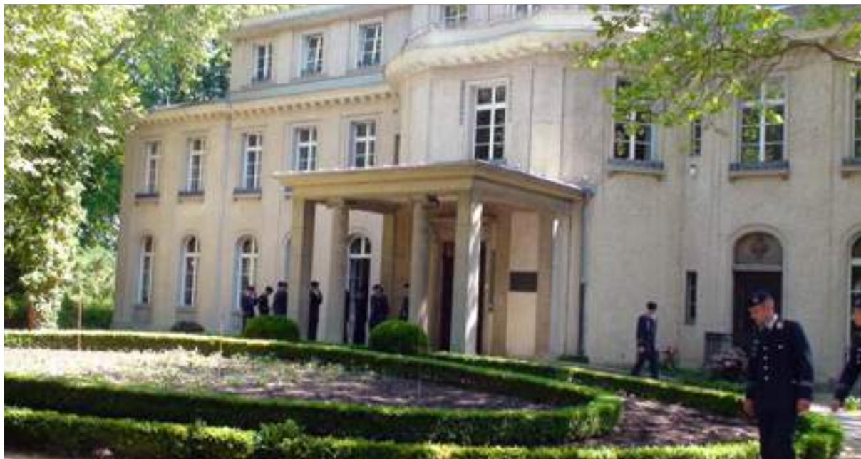
Recinte de la Conferència de Wannsee (Berlín)