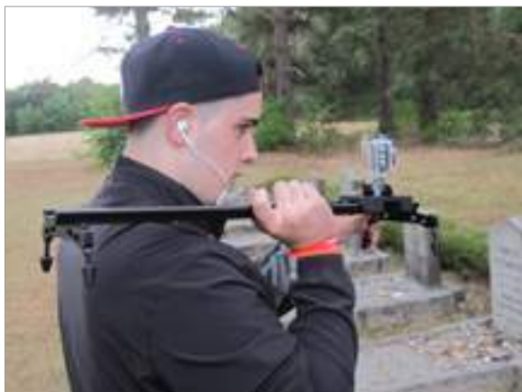
Gravant a Bergen-Belsen.