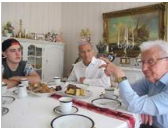
Berenant a casa de Salomon

pel fet de ser jueu. El 5 de setembre, la casa de la família Korman va ser destrossada per les bombes. La família va sobreviure a l'atac. El saqueig per l'exèrcit alemany (Wehrmacht) i la policia militar va ser seguit severament per l'assetjament de la població jueva per les SS i l'SD.