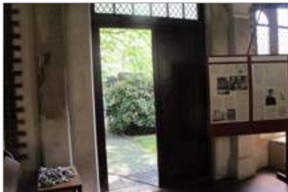
Strangliede, la sala on eren agrupats i malviven grups de 200 jueus, i la sortida al cementiri.