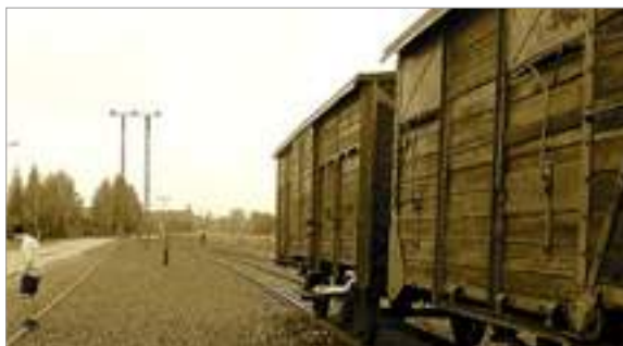
Rampa final de l'estació inicial d'Auschwitz abans de fer el tram de Birkenau

El primer camp de concentració es va posar en funcionament el 23 de març de 1933, a Dachau, dos mesos