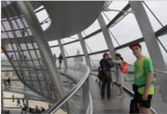
Cúpula del Reichstag