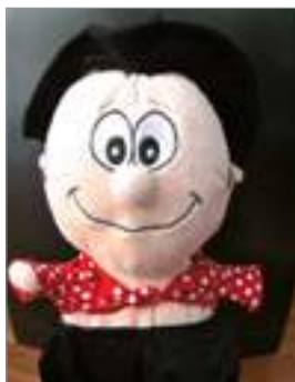
Pla americà o tres quarts