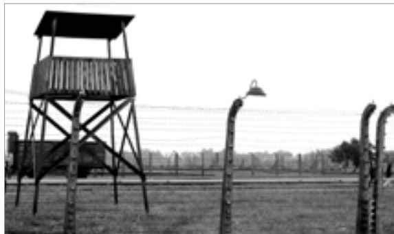
Torreta de vigilància a Auschwitz-Birkenau

i d’assassinat massiu per mètodes industrials) on van empresonar i van tractar de forma brutal a aquells que consideraven opositors al règim; comunistes, socialistes, líders sindicals i qualsevol que suposés una “ame-naça”: gitanos, jueus, testimonis de Jehovà, etc.