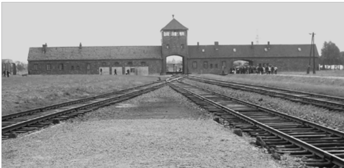
Entrada del camp d'Auschwitz-Birkenau

1941 hi ha un fet clau en la guerra: el Japó ataca la base naval nord-americana de Pearl Harbor, al Pacífic, i els Estats Units, fins llavors neutrals, decideixen entrar en la guerra. La participació dels americans va canviar la sort dels aliats. A partir de llavors, les forces s'anaren equilibrant fins a arribar a la victòria definitiva dels aliats, que van fer valer la seva superioritat material.