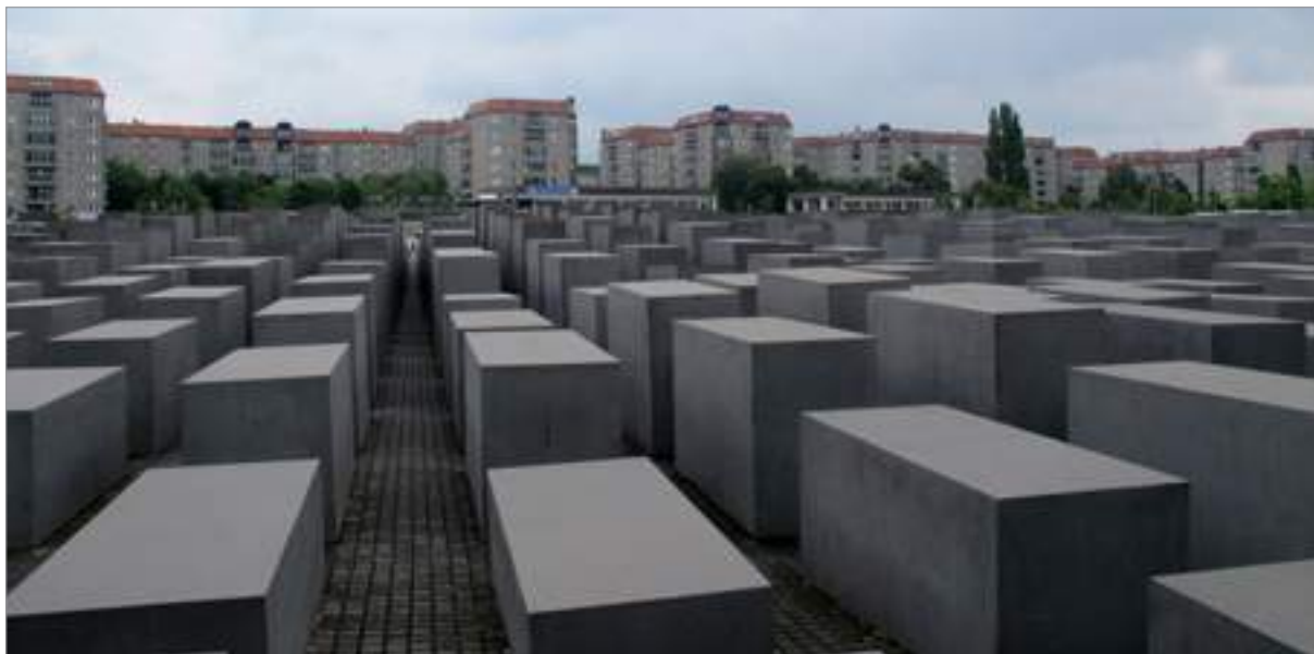
Impressionant monument a les víctimes de l'Holocaust en forma de laberint

És a pocs metres d'on hi havia el búnquer d'Adolf Hitler, on actualment només hi ha un solar i un plafó explicatiu. I, a sota, hi ha un centre de documentació sobre l'Holocaust: en primer terme, sis retrats que simbolitzen els sis milions de jueus massacrats. No va ser fins al juny del 1999 que el Bundestag, en la seva penúltima sessió abans de tornar a Berlín des de Bonn, el va