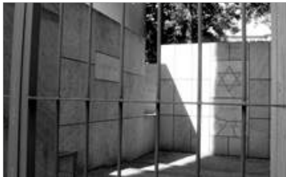
Monument al lloc on hi havia l'antiga sinagoga de Hannover, cremada durant la Kristallnacht