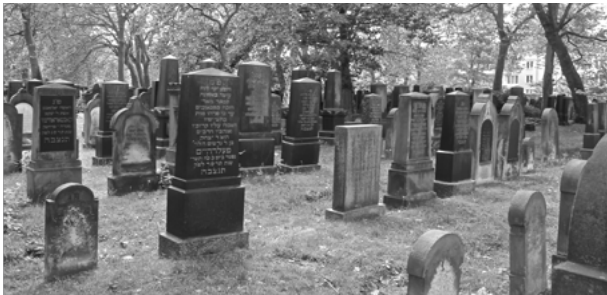
Cementiri jueu de Hannover, amb víctimes de la Xoà

població, cristiana o protestant (o ortodoxos també a Rússia). Des dels anys 20 vivien amb por i amb atacs habituals a les seves cases i als seus negocis. Molts van marxar ja a Amèrica en aquells anys, fet que va fer possible que, amb la pujada al poder de Hitler el 1933, molts d'altres anessin a viure amb els seus familiars instal·lats als EUA o a Sud-Amèrica, i que els supervivents anessin majoritàriament a Palestina-Israel però també a aquests països, on ja no hi van poder fugir a partir de 1941, quan Hitler va tancar les portes definitivament.