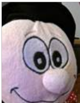
Primeríssim primer pla