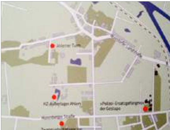
Els diferents recintes durant l'ocupació de la Gestapo i l'edifici del museu actual