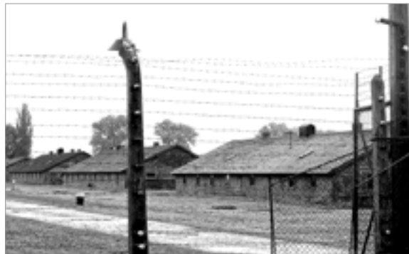
Zona del camp de dones a Auschwitz-Birkenau

https://www.youtube.com/watch?v=VBe3fLen3fw