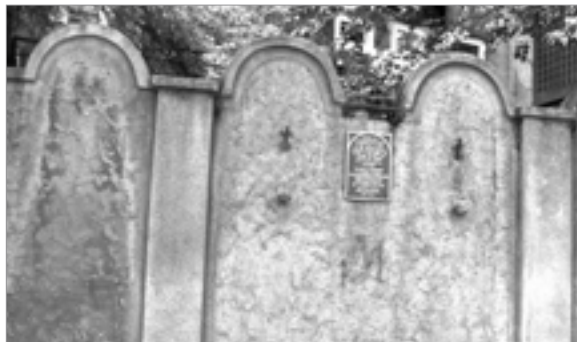
Mur del gueto de Cracòvia

Els dos guetos més grans van ser el de Varsòvia i el de Lodz (164.000 jueus), a Polònia. A la capital, hi van recloure 375.000 jueus en dues zones molt petites, connectades per un pas primer, i un pont més tard. Era un 30% de la població de la ciutat. Portaven un braçalet blau i blanc amb l'estrella de David al braç i les seves condicions van ser molt lamentables, com es pot veure