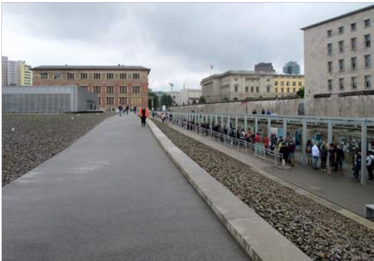
A l'esquerra, l'edifici de la Topografia, a la dreta, restes del mur i de les dependències de la SS i la Gestapo

L'any 1987, en el marc de les celebracions del 750 aniversari de la ciutat de Berlín, es va obrir finalment l'accés al públic a aquesta zona. Actualment es pot visitar una exposició a l'aire lliure en les excavacions localitzades a Niederkirchnerstraße que configuren l'anomenada Topografia del Terror allà on hi havia uns edificis en els quals el terror estava a l'ordre del dia.