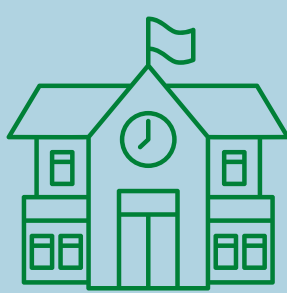
INS Frederic Martí i Carreras

DES DE L'ÀREA D'EDUCACIÓ DE L'AJUNTAMENT DE PALAFRUGELL S'HA DONAT RESPOSTA A LA DIVERSITAT DE L'ALUMNAT DEL MUNICIPI A TRAVÉS DE L'APRENTATGE ESPORTIU