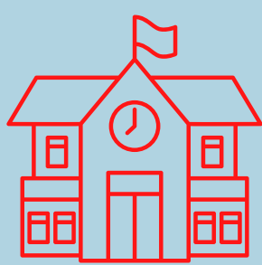
INS Baix Empordà