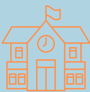
INS Prats de la carrera