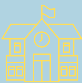
INS La Sureda