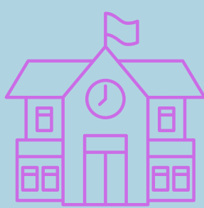
Escola Sant Jordi