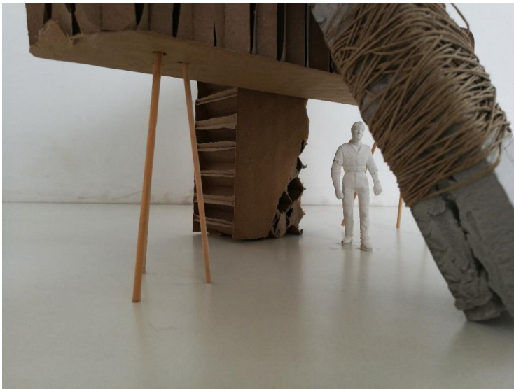
Tema de les escultures: Un refugi davant del col·lapse