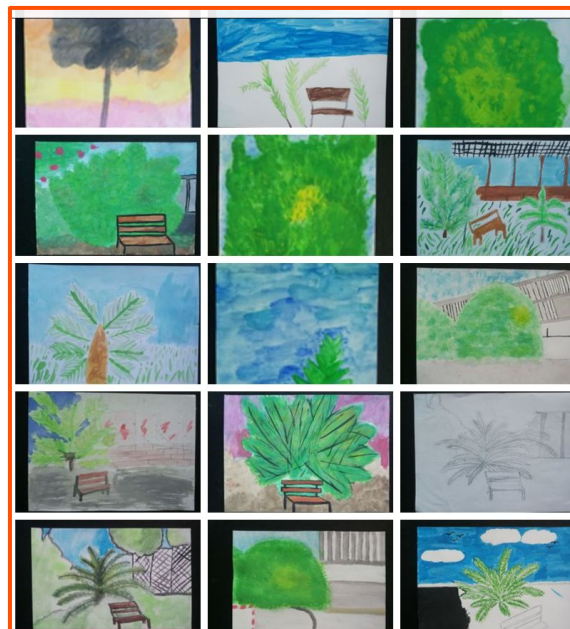
Institut Montjuïc (Barcelona) - 4t d'ESO