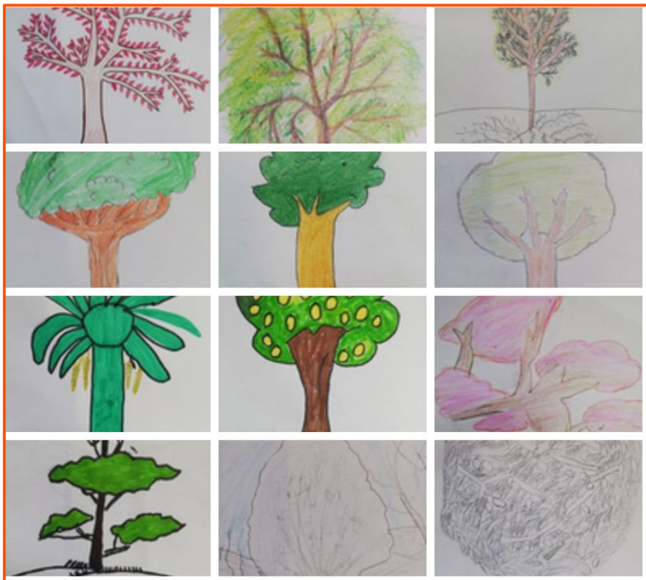
Institut Milà i Fontanals (Barcelona) - Aula d'acollida