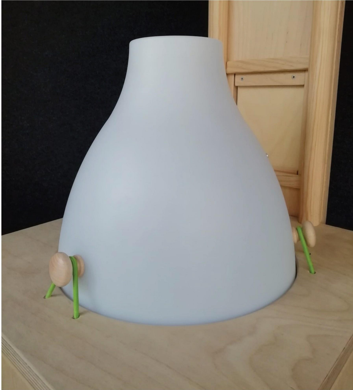
Encaixa r la campana amb les gomes verdes.