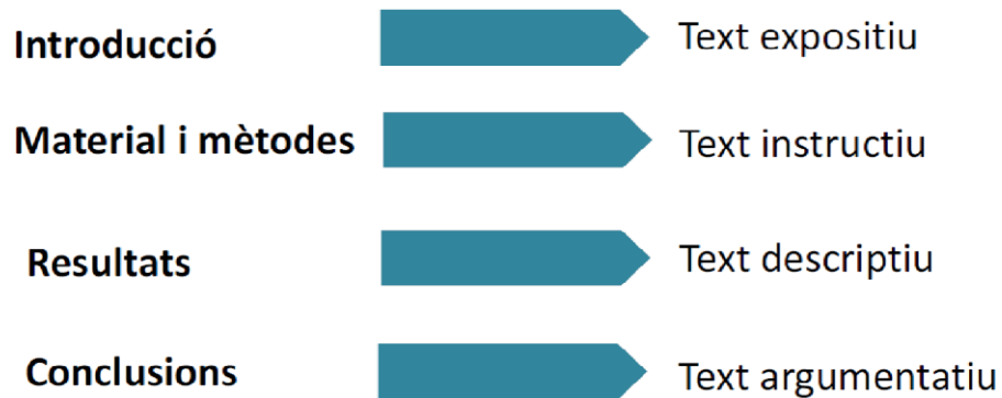
Il·lustració 1: Relació entre els apartats d'un article científic i les tipologies textuais.

Per tant, si les tipologies textuais són formes abstractes, els gèneres discursius són formes reals, que neixen de necessitats comunicatives concretes, determinades pel que es vol dir i pel context on es vol dir. Per tant, són vius i no n'hi ha una categoria tancada, perquè si sorgeixen noves necessitats comunicatives apareixeran gèneres discursius nous o evolucionaran els existents.