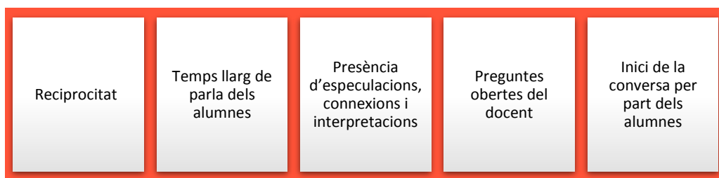
Indicadors de qualitat de la conversa

Per fomentar una veritable interacció comunicativa és necessari que el docent formuli preguntes productives , que portin l'alumne a elaborar respostes complexes, i que vetlli per la qualitat de la conversa .