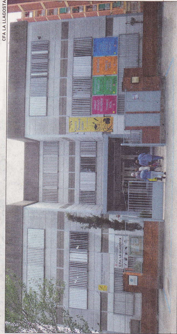
CFA LA LLAGOSTA

NECESSITATS L'aprenentatge d'idiomes i la preparació per a l'accés a la universitat, els cursos més demandats